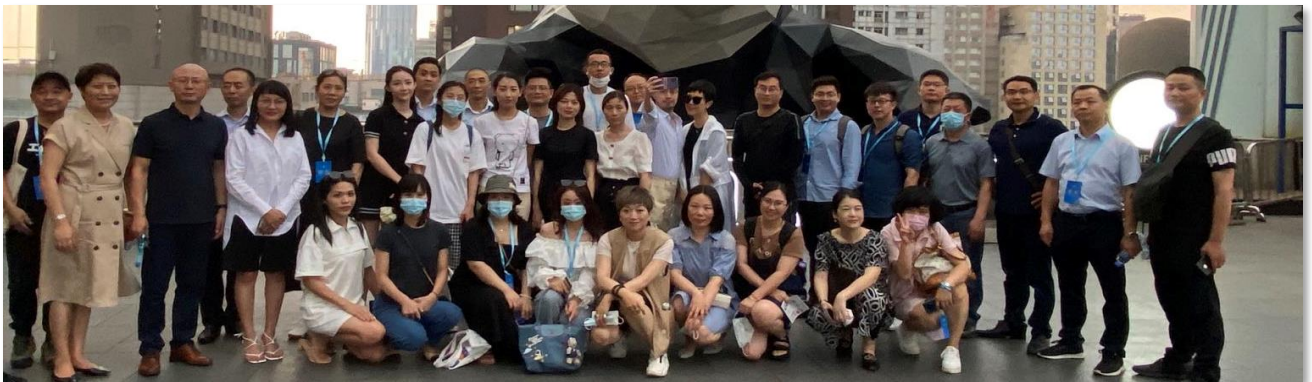
成都 IFS 和太古里参观考察