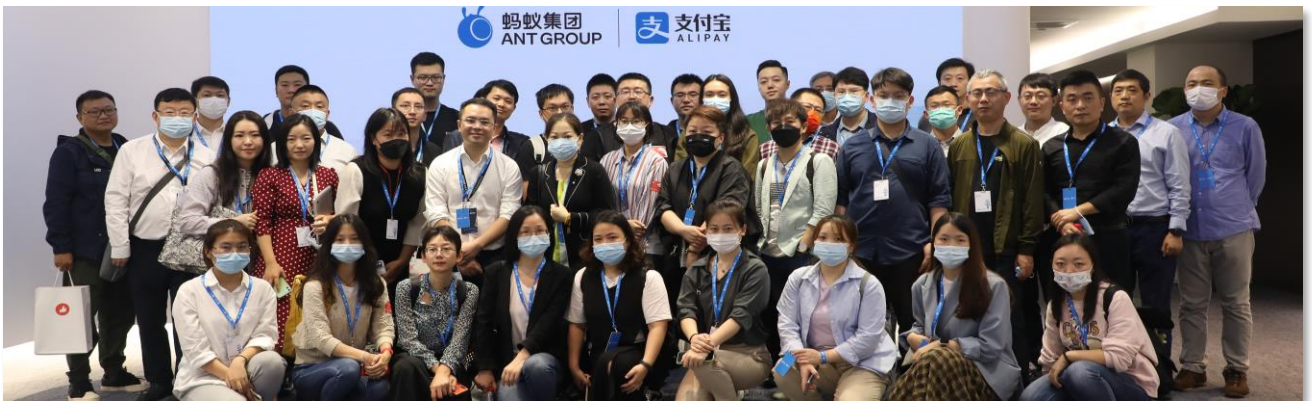
蚂蚁集团参观考察