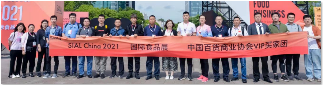
第二十二届 SIAL China 中国国际食品饮料展览会