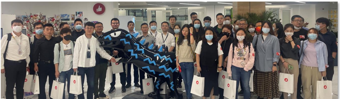
有赞总部参观考察