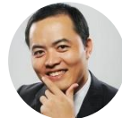
肖利华 阿里巴巴集团副总裁 阿里云研究院院长